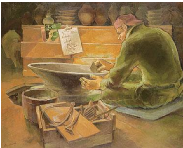
第86回展 復興祈念 (F100)