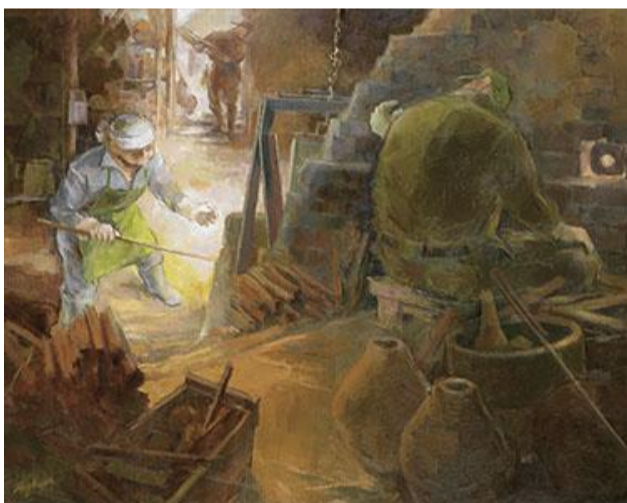
第84回展 合図で・・・ (F100)