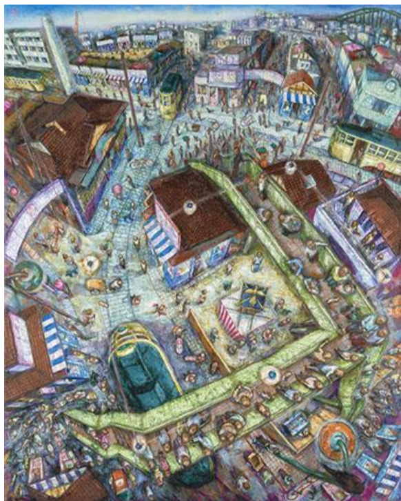
第84回展 ハレの日 (F150)