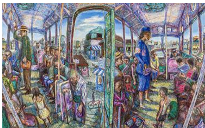
第86回展 Bus (変120)