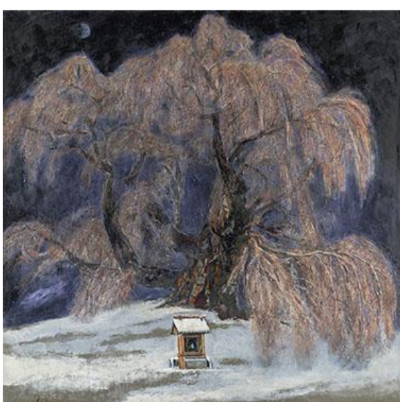
第 84 回展 神何処—三春滝桜— (S100)