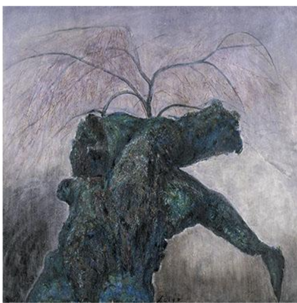
第 86 回展 蘇る大樹 (S100)