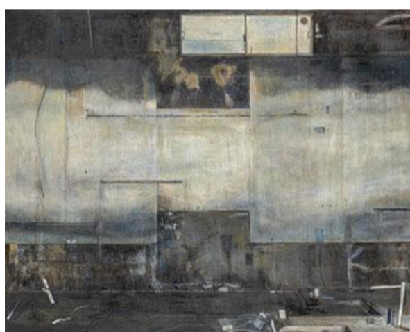
第 86 回展 残照 (F100)