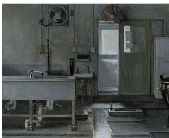
第 84 回展 早春の一室 (F100)