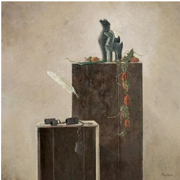
第 86 回展 想い (S60)