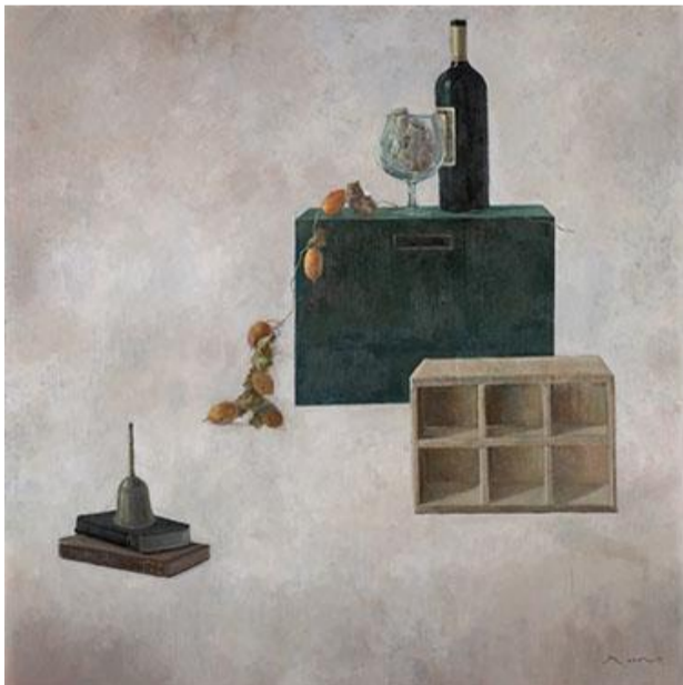
第 84 回展 刻 (S80)