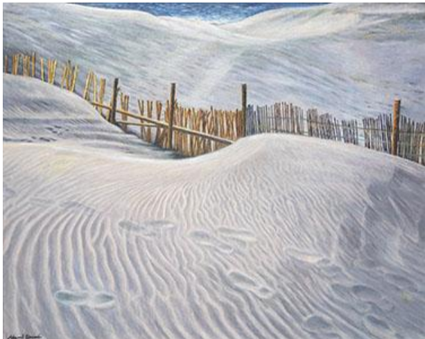
第 84 回展 砂上の旋律 (S100)