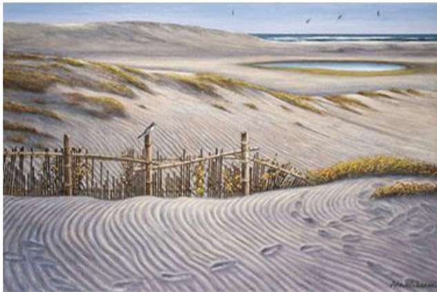
第 8 6 回展 砂上の模様 (F100)