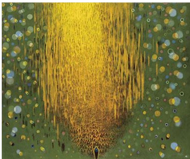
第 84 回展 魂の行方 (F130)