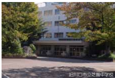
旧川口市立芝園中学校

ができました。上野駅からJR京浜東北線で二五分、【蕨駅】下車、徒歩一〇分。廃校になった旧川口市立芝園中学校。川口市より文化事業を目的とした団体を対象に、今年の十一月中旬から五年間無料で空き教室を借りられるという情報を得て、2教室を借り受けることにしたものです。