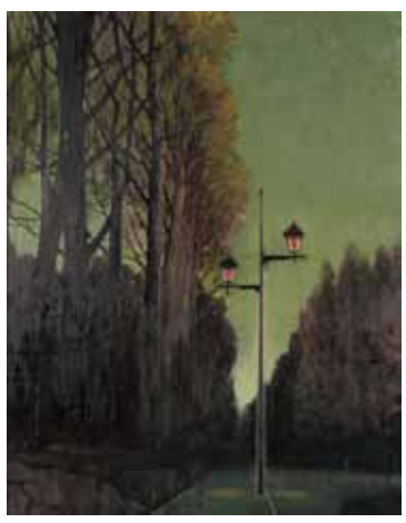
ともしび 本山 唯雄