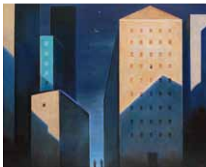
安井曾太郎奨励賞 朝の月・人と樓家と 保坂 晶