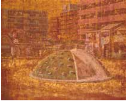
損保ジャパン美術財団賞 或る風景 久保 慶議