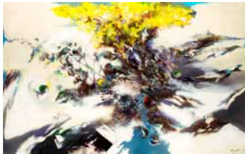
静物 田中 義昭