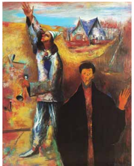
シハイラプソディ F100 第30回記念一水会展 一水会賞

けないんでね。先生を超えて自分の世界を創って初めて尊敬したことの証になるわけで、ただ模倣しているのは尊敬の証ではないと思う。