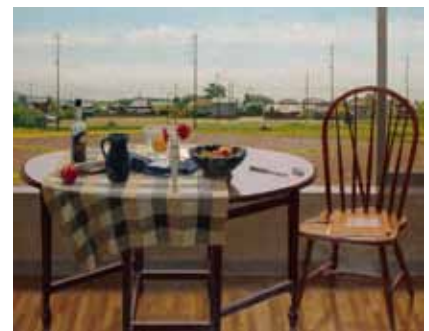
会員佳作賞 窓辺の光景 新井 隆