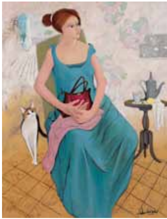
サンタ・バーバラから来た女 菱田 義宣(遺作)